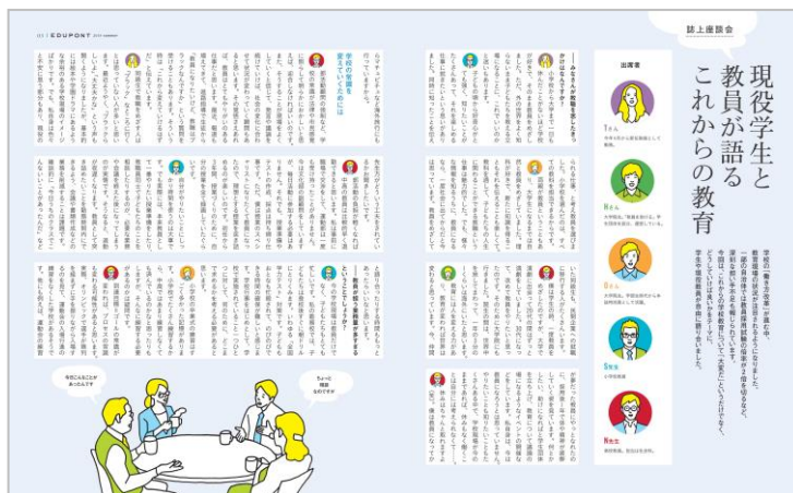
特集 誌上座談会 現役学生と教員が語るこれからの教育

今号の表紙を飾るのは、ロックバンド flumpool のボーカル・山村隆太さん。学生時代、教員を志したきっかけや教員実習の思い出、音楽の道に進むことを決断したきっかけなどについて伺いました。特集は、小学校と高校の現任教員と教職志望の大学生との座談会を実施。学校現場の実態や近年、報道などで注目されている学校の働き方改革の問題などの観点から、「これからの教育」に語り合っていました。詳しい内容などに関しては下記問い合わせ先まで。